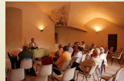
Conférence sur la Trinité