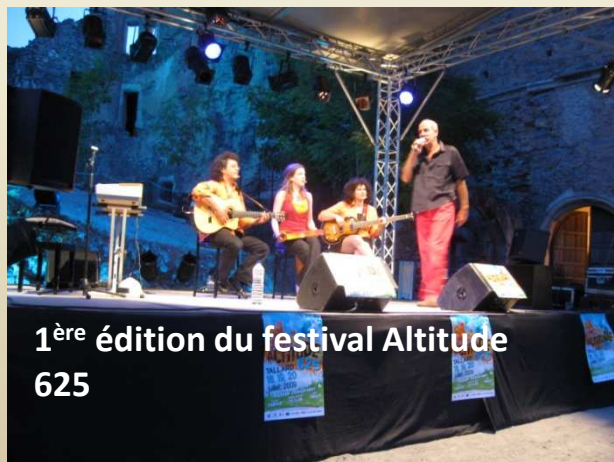
1 ère édition du festival Altitude 625