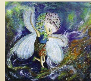
L'Automne des peintres