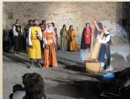
La Geste des terres hautes (le roman de silence)