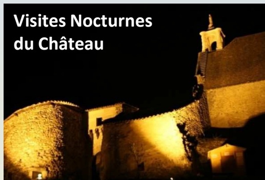
Visites Nocturnes du Château