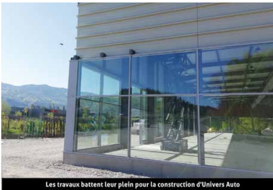
Les travaux battent leur plein pour la construction d'Univers Auto

C'est une satisfaction pour l'équipe municipale de voir ce projet aboutir avec des enseignes reconnues et des entrepreneurs motivés et satisfaits de leur choix de s'implanter à Tallard.