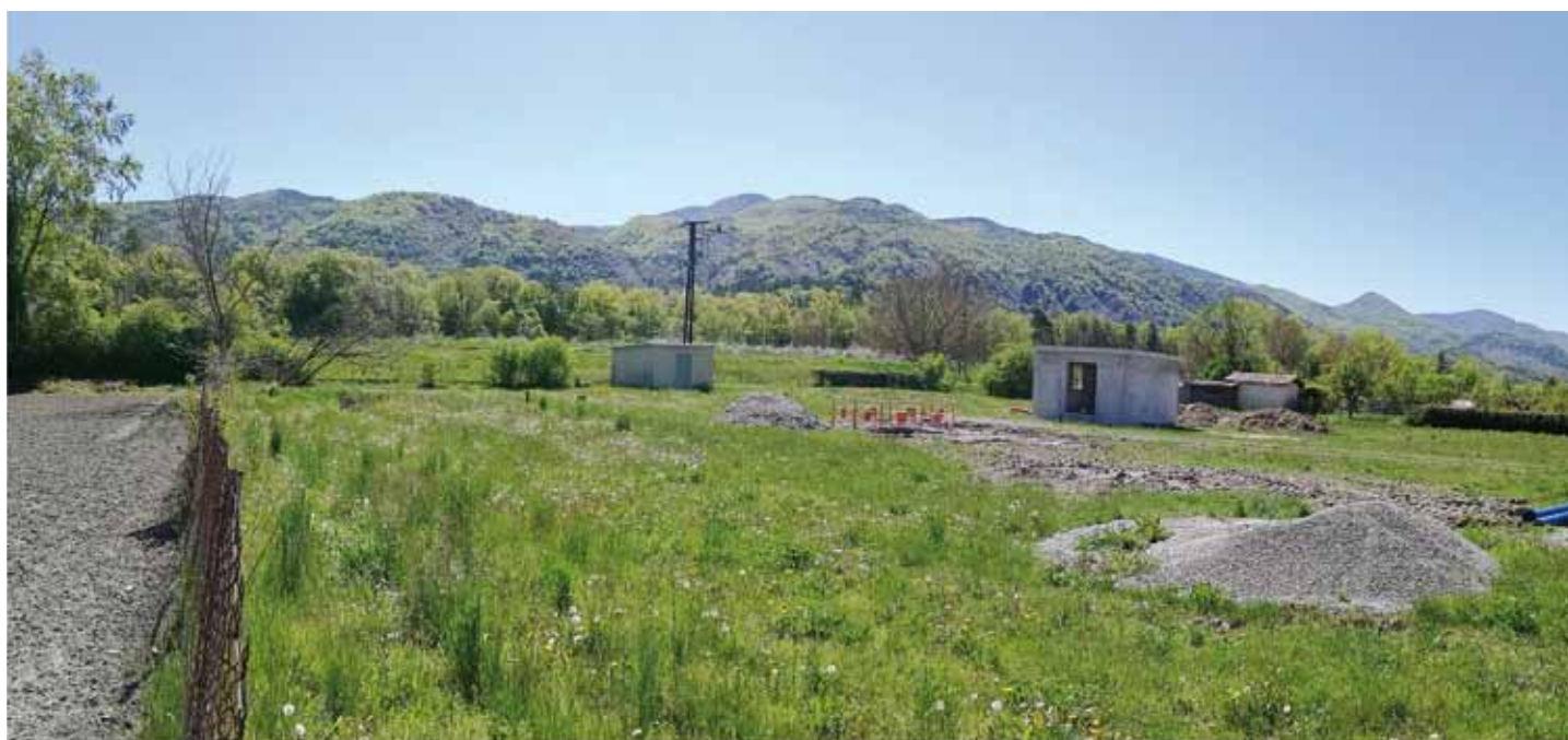
Les travaux au puits de captage des Jardins permettront de sécuriser l'alimentation en eau potable de la commune