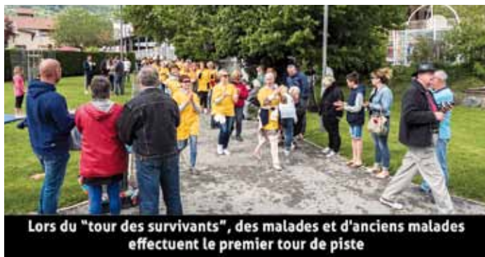
Lors du "tour des survivants", des malades et d'anciens malades effectuent le premier tour de piste

Le Relais pour la vie se veut avant tout une grande fête populaire et familiale, mêlant challenge sportif et détente. Des manifestations culturelles sont organisées et créées spécialement pour l'occasion : ateliers, expositions, jeux