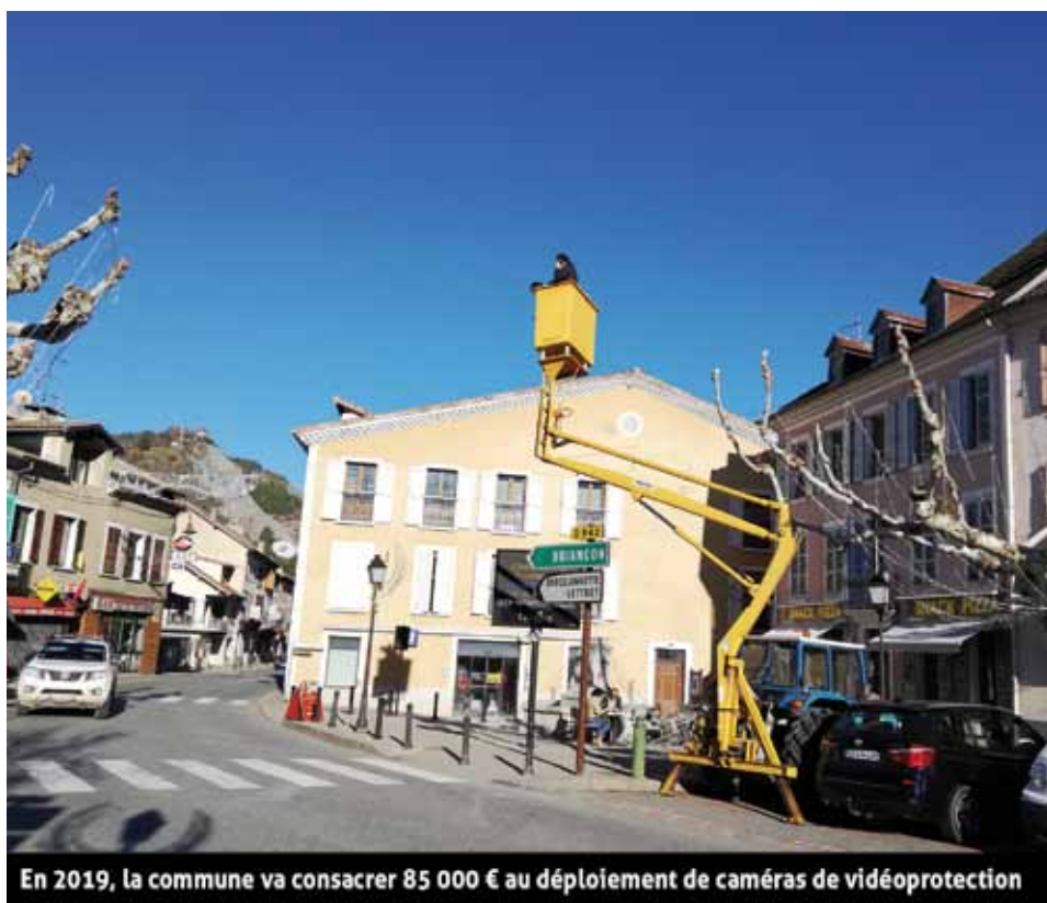
En 2019, la commune va consacrer 85 000 € au déploiement de caméras de vidéoprotection